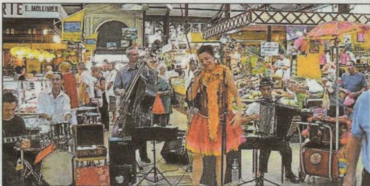
■ Fou jusque dans les halles