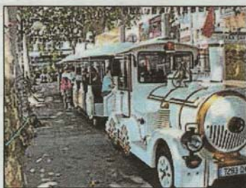
■ Encore quelques jours pour le petit train