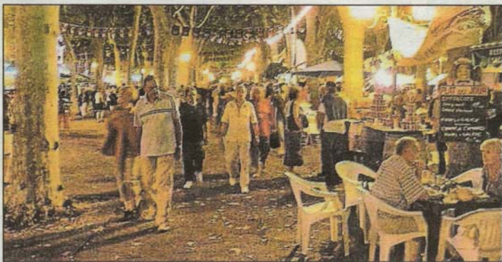
■ Les barques envahies durant ces quarante huit heures