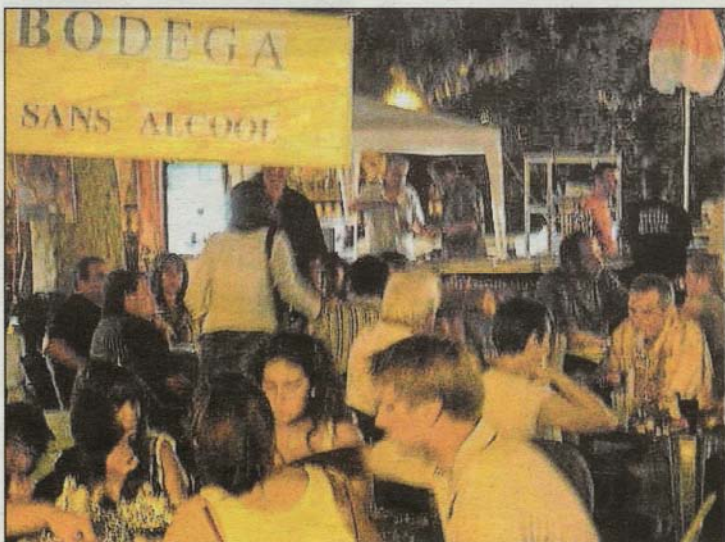
■ Et oui, même sans alcool ça marche