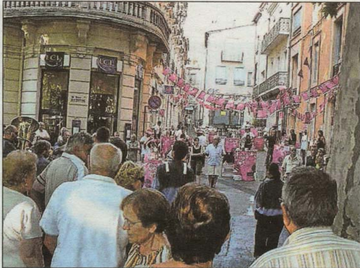
■ Des bodégas dans les moindre recoin